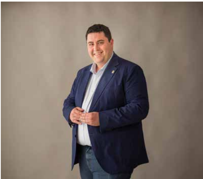
ALCALDE PRESIDENT DE L'AJUNTAMENT DE NULES

La devoció i fervor que el poble de Nules té per la seua patrona, la Mare de Déu de la Soledat, es manifesta més si cap al llarg de les festes patronals que celebrem en el seu honor. En aquests dies cobren protagonisme els actes culturals i com no els religiosos amb els quals els nulers i les nuleres, al igual que feien els nostres avantpassats, venerem a la nostra benvolguda patrona.