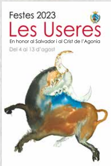
PORTADA CONCURS JERÓNIMO URIBE CLARÍN