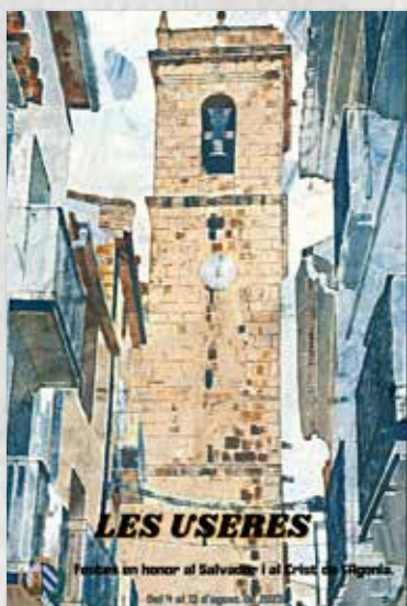
PORTADA CONCURS MARTA PALANQUES PRADES