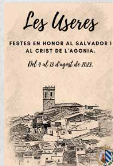
PORTADA CONCURS SAÛL BERNAT RIBÉS