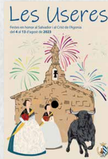
PORTADA CONCURS ALBA ESCRIG CENTELLES