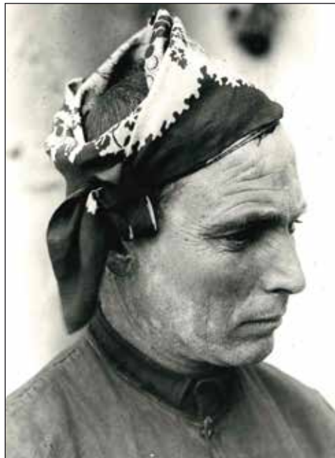
Indumentària típica del poble. Any 1919.