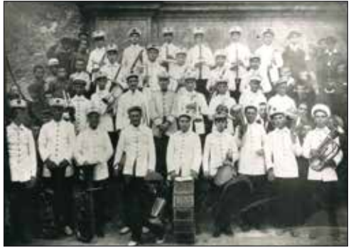
La Banda de Nules, any 1926.