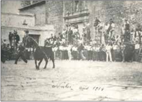
Bou al carrer any 1934.