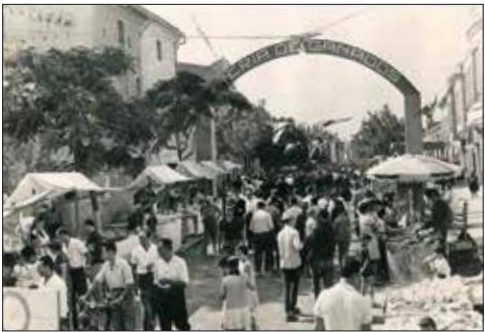
Fira Agrícola de Nules, Setembre de 1962.