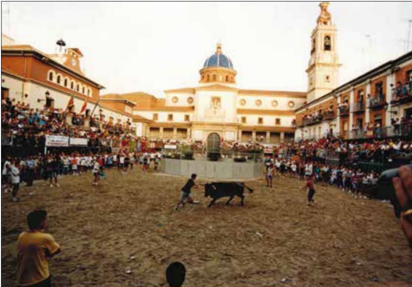
Plaça Major de Nules, vesprada de bou per la Vila.

De 10:00h a 14:00h. i de 16:00h a 22:00h. A la Plaça Major, desmuntatge de cadafals.