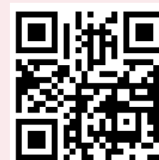
APP "CAUDIEL EN TU MANO"