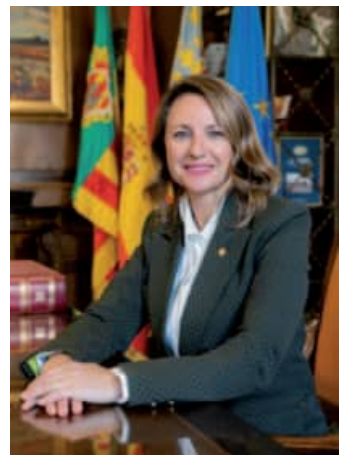
Begoña Carrasco Alcaldessa de Castelló

Gràcies per fer que la llum de les nostres gaiates, de la nostra gent, brille amb llum pròpia com a símbol i ambaixadora de la nostra ciutat a Gavà. Esperem que aquesta col·laboració continue per molts anys.